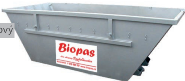
typ velký hákový nosič MAN