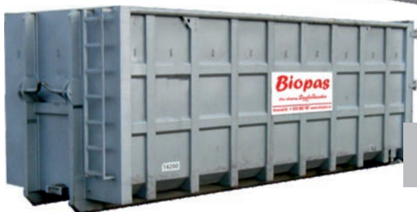
ABROLL na velkoobjemové odpady