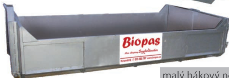
malý hákový nosič MAN na stavební suť