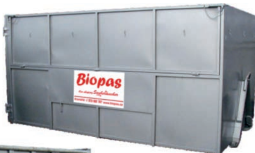
typ malý hákový nosič MAN

Významnou část služeb společnosti Biopas tvoří odvoz a odstranění objemných odpadů, stavebních odpadů, dřeva, pneumatik a jiných nadrozměrných odpadů. Na tyto odpady nabízíme velkoobjemové kontejnery typu Abroll, MAN (AVIA) nebo mulda (LIAZ) o objemu od 3 do 35 m 3 .