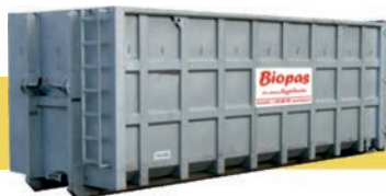
ABROLL na velkoobjemové odpady