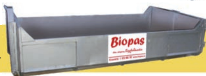
malý hákový nosič MAN na stavební suť