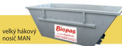
velký hákový nosič MAN