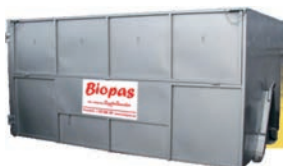
typ malý hákový nosič MAN

Významnou část služeb společnosti Biopas tvoří odvoz a odstranění objemných odpadů, stavebních odpadů, dřeva, pneumatik a jiných nadrozměrných odpadů. Na tyto odpady nabízíme velkoobjemové kontejnery typu Abroll, MAN (AVIA) nebo muřda (LIAZ) o objemu od 3 do 35 m 3 .